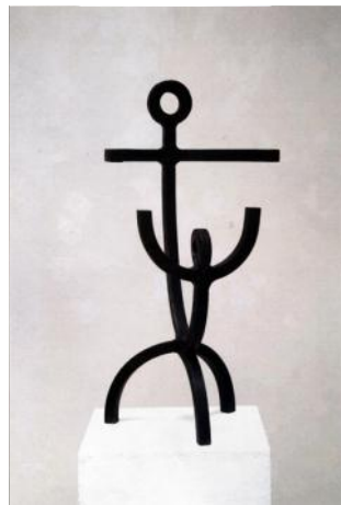
Obr. 3: Model vztahy - mateřské. Chtěl jsem pomocí abstraktních prvků vyjádřit ten věčný a hluboký vztah.

ZNÁM JE MOC DOBŘE NEZAPŘU RUKAVIČKY MÉ ŽENY