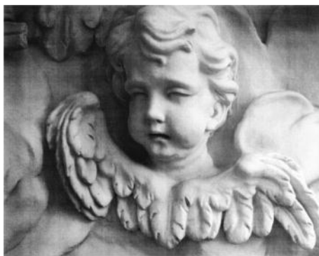
Obr. 2: Učňovská práce, nad vchodem fasády kostela na Sv. Kopečku, výška asi 70 cm.

Téma rodiny, mateřství a ženství mne však provází neustále, to je vidět například na modelu Vztahy (obr. 3).